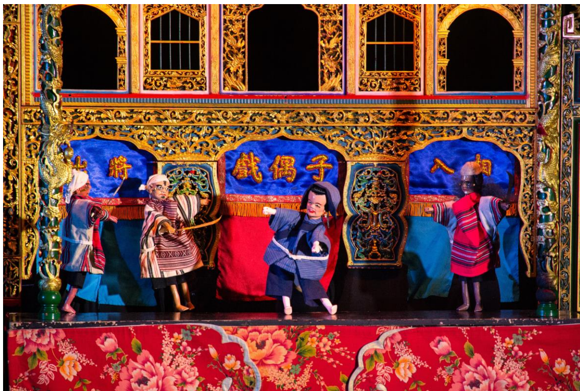
《阿火與 jean 的福爾摩沙奇幻之旅》