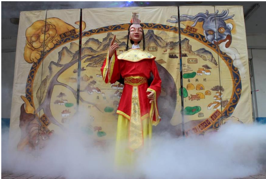
《吼！大路關石獅公傳奇》