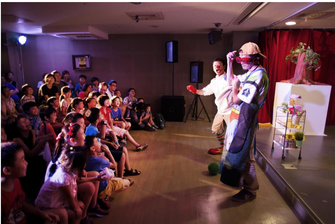
《貓園丁》大稻埕戲院售票演出