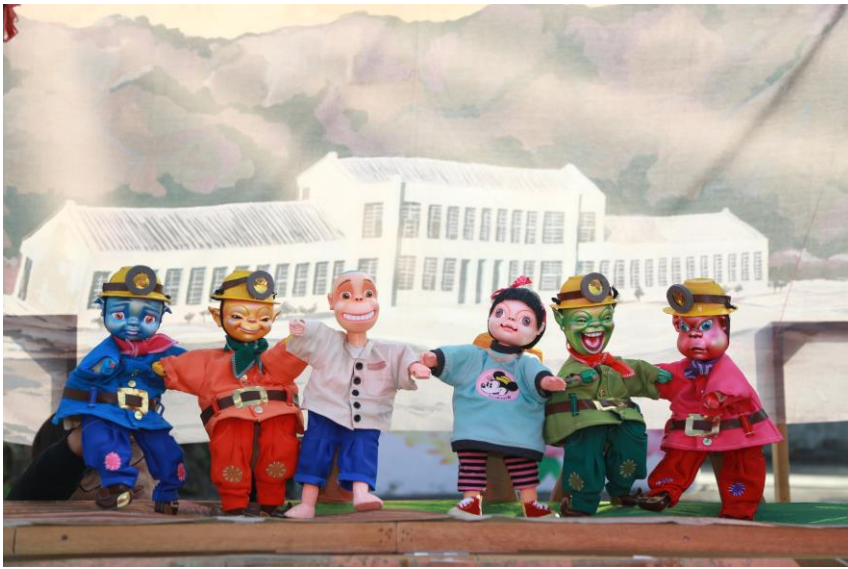
《滾水阿弟牯，快跑！》客委會補助演出