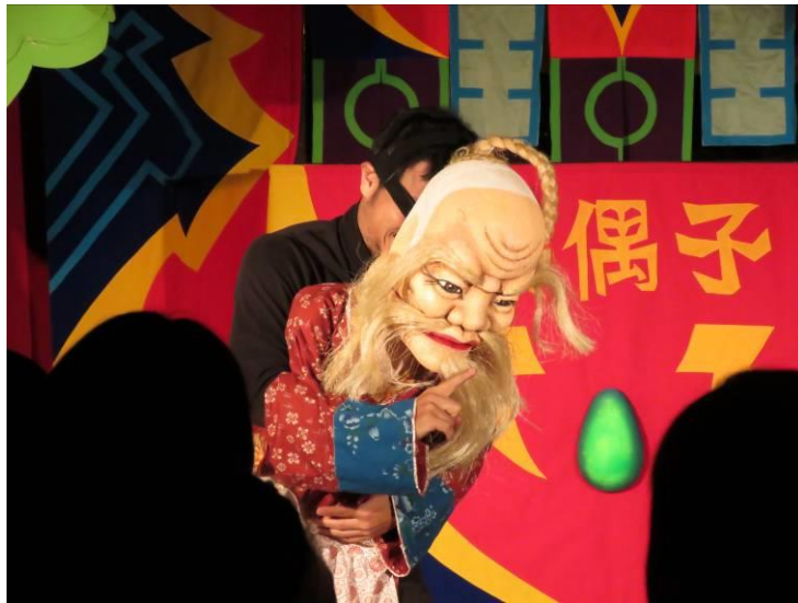
《蛋蛋超人》大傀儡偶