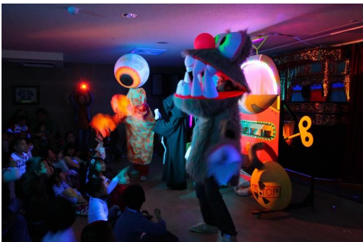
《夢想罐頭》黑光劇偶