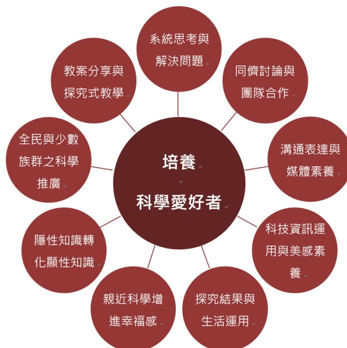
圖 1、全國科學探究競賽核心價值

本競賽的核心目的為「 培養科學的愛好者 」，藉由競賽讓同儕間進行討論與團隊合作，從討論間系統思考與解決問題，將隱性知識轉化成顯性知識，系統化的將研究結果記錄在影音及文字中，培養科技資訊運用與媒體溝通表達的素養，最終能夠將探究結果運用在生活周遭中。對於女性、新二代及原住民的作品都有適當加分，以鼓勵他們發揮科學探究精神。對於優秀作品本計畫也期待能夠加值其價值，例如出版刊物或親自演示，如此完整構成本競賽的核心價值的圖，如下圖 1 所示。